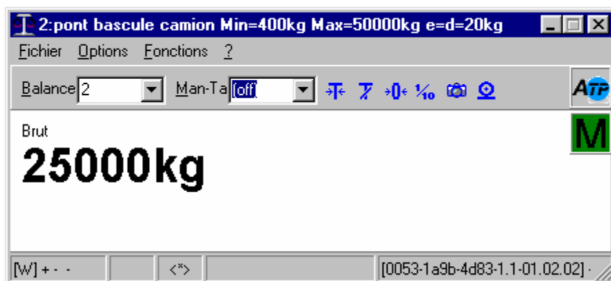
Fig 2 : valeurs de pesées sauvegardées utilisation légale